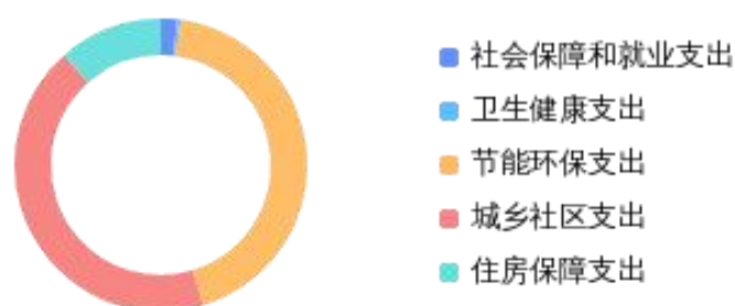
一般公共预算财政拨款支出决算结构情况

2024 年度一般公共预算财政拨款支出 31401.19 万元，主要用于以下方面：社会保障和就业支出支出 557.81 万元，占 1.8%；卫生健康支出支出 122.17 万元，占 0.4%；节能环保支出支出 13553.11 万元，占 43.2%；城乡社区支出支出 13571.46 万元，占 43.2%；住房保障支出支出 3596.62 万元，占 11.5%。