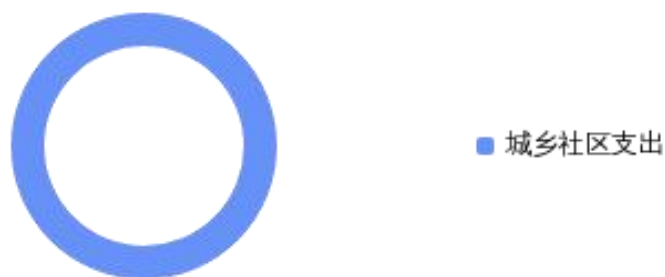
一般公共预算财政拨款支出决算结构情况

2024 年度一般公共预算财政拨款支出 1229.77 万元，主要用于以下方面：城乡社区支出 1229.77 万元，占 100%。